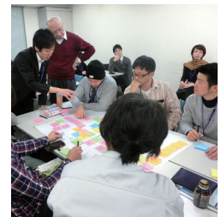
2日目グループワークの様子