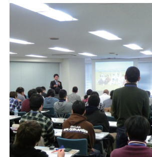
講師による講義の様子